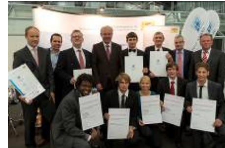
Die Gewinner des Smart Mobile Awards 2012