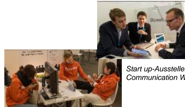
Start up-Aussteller auf der Communication World 2012